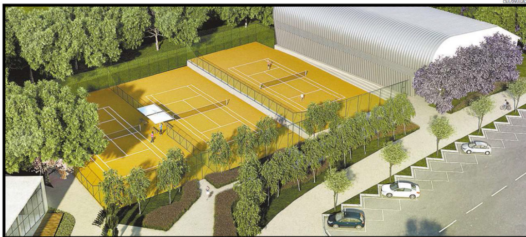
Perspectiva da Costa Laguna, empreendimento da CSul na Lagoa dos Ingleses: loteamento tem quatro quadras profissionais de saibro

Muitas construtoras mantêm o foco na região limite entre BH e Nova Lima, apostando em empreendimentos que contemplam prédios de luxo residenciais, comerciais ou mistos