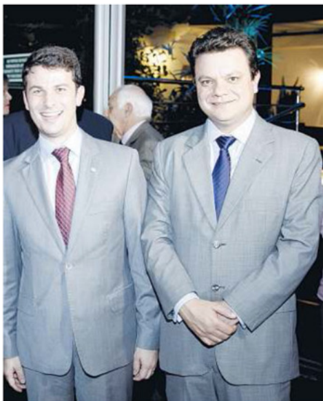
O deputado federal Marcelo Aro e o secretário de Estado de Governo, Odair Cunha